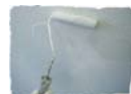
らくらくメンテナンス

水性無臭なため住みながらリモデルできます。 有害物質を吸着し、 バツグンの脱臭力でお部屋の空気をきれいにします。 ホコリを防ぎ、壁や天井のキレイを保ちます。 優れた吸放湿性でカビ・ダニを防ぎます。 夏はサラサラ、冬はしっとりの空間を作り出します。